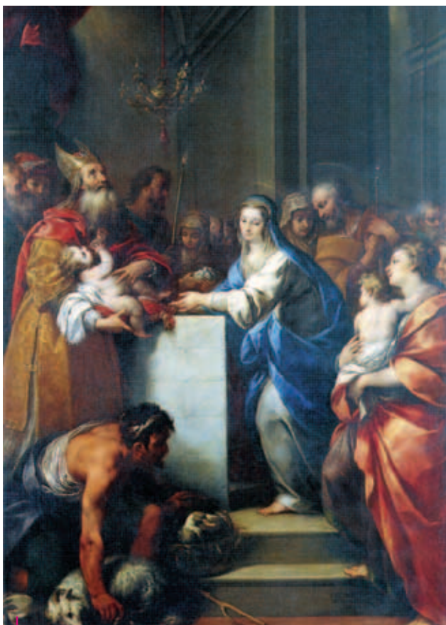
Carlo Francesco Nuvolone, Purificazione (1645) Piacenza, Pinacoteca di Palazzo Farnese