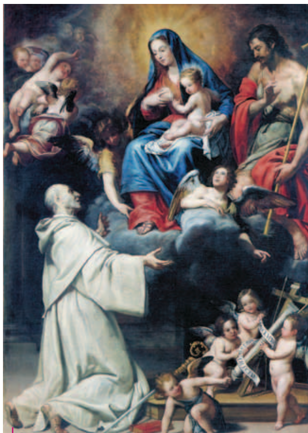
Domenico Fiasella, San Bernardo da Chiaravalle allattato miracolosamente dalla Vergine (1643) Piacenza, Pinacoteca di Palazzo Farnese