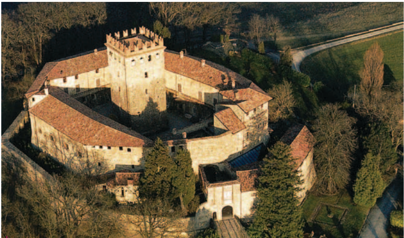
Rivergaro, Castello di Montechiaro, veduta aerea

Po , rispettivamente libretto per la festa a cavallo del carnevale del 1644 a Piacenza e libretto per balletto fatto nella Cittadella di Piacenza nel carnevale del 1664, e il Diario della Peste del 1630 , trascrizione del manoscritto redatto da Morando ritiratosi nella contea di Montechiaro in Val Trebbia per sfuggire al contagio che aveva investito anche la città di Piacenza. Tra le illustrazioni comparirà anche la ricostruzione grafica del Teatro di Piazza, il teatro in legno inserito nel salone del Palazzo Gotico nel 1642 e demolito alla fine dell'Ottocento. I testi saranno preceduti dai commenti di Stefano Pronti. Essendo inediti i libretti e poco conosciuto il diario, il volume porterà in luce due aspetti del grande autore piacentino e verrà presentato proprio nel Palazzo Morando in Via Romagnosi, attuale sede del Comando di Presidio Militare.