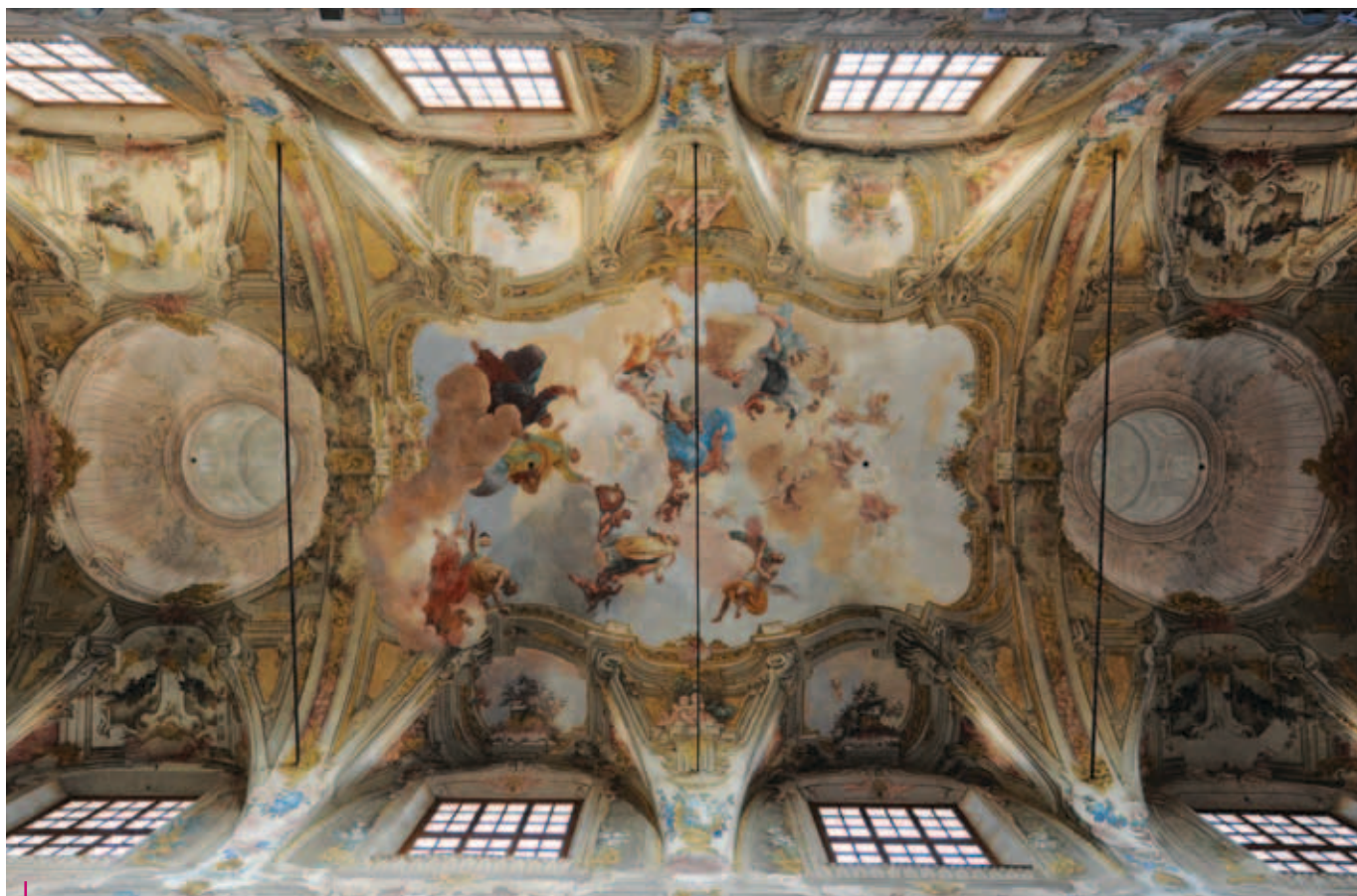
Piacenza, Sala dei Teatini (Ex Chiesa di San Vincenzo), volta centrale

La forma architettonica richiama la chiesa madre di S. Andrea della Valle di Roma e si distingue per avere una cupola di grandi dimensioni, che crea un movimento prospettico verticale verso l'alto, simbolicamente verso la divinità. Le commissioni artistiche furono ricche e riguardano le pale d'altare e gli affreschi del coro e del transetto. Nei decenni successivi si provvide all'apertura della chiesa di S. Vincenzo e precisamente: S. Bernardo del genovese Domenico Fiasella e S. Carlo del bolognese Alessandro Tiarini rispettivamente nella seconda e nella quarta cappella a sinistra, S. Cecilia del fiorentino-genovese Sebastiano Galeotti, S. Andrea Avellino colpito da apoplezia mentre celebra la messa dell'urbinate